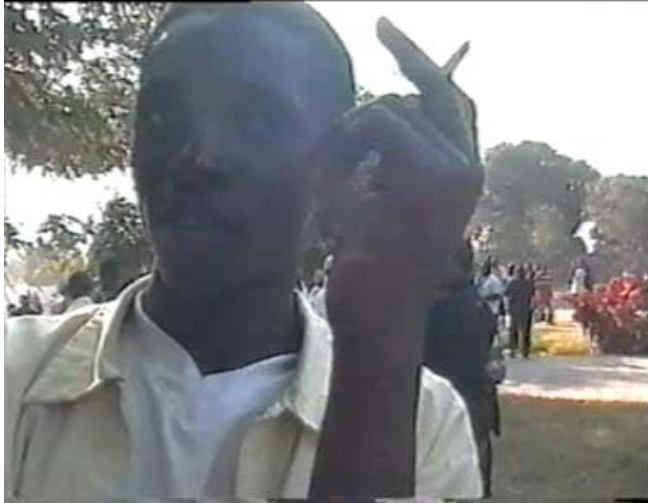
Les enfants fumeurs de la ville de Lubumbashi